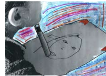
«Anime qui tu es»