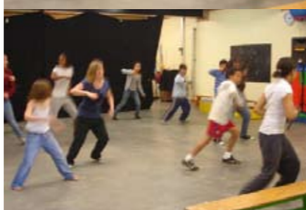
L'atelier de danse hip-hop