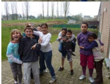
l'atelier du Buston